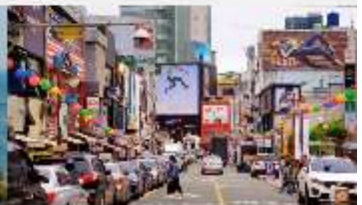
nampodong shopping street

*ทางบริษัทฯ ขอสงวนสิทธิ์ในการสลับโปรแกรมทัวร์ตามความเหมาะสมขึ้นอยู่กับสถานการณ์หน้างาน โดยคำนึงถึงผลประโยชน์ของลูกค้าเป็นสำคัญ