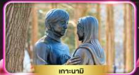
เกาะนามิ