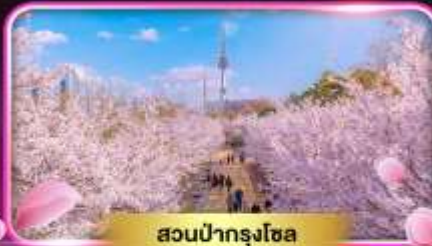
สวนป่ากรุงโซล