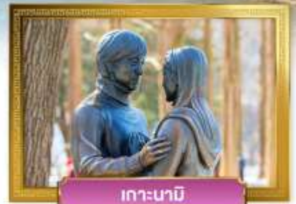
เกาะนามิ

เดินทางโดย : สายการบินแอร์เอเชียเอ็กซ์ (XJ)