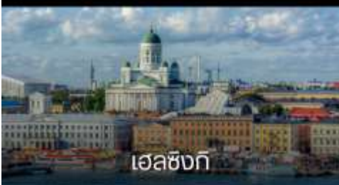
เฮลซิงกิ