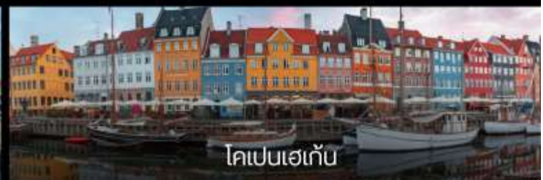
โตปเปเนเก้บ