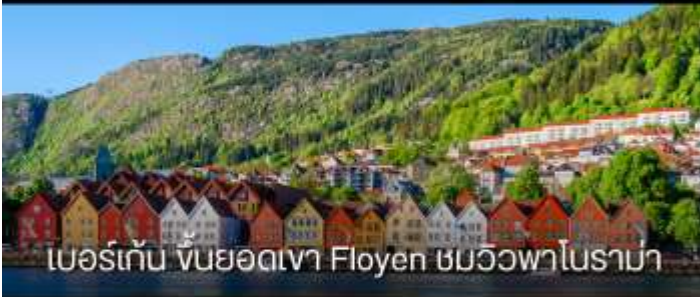
เบอร์เก้น ทัศนียภาพ Floyen ชมวิวพาโรราฆ่า