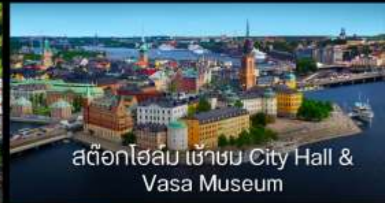
สต็อกโฮล์ม เข้าชม City Hall & Vasa Museum