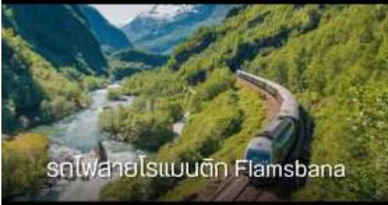
รถไฟสายโรแมนติก Flamsbana