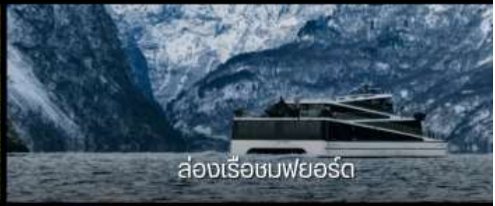
ล่องเรือชมฟยอร์ด