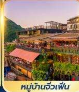
หมู่บ้านจิวเฟิ่น