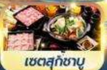
เซตสุกัซามู