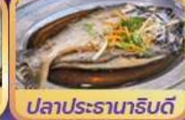
ปลาประธาราธิบดี