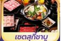
เซตสุกัชาบู