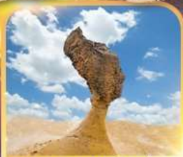
อุทยานเหยหลิว