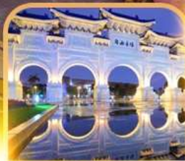
เจียงโคเซค