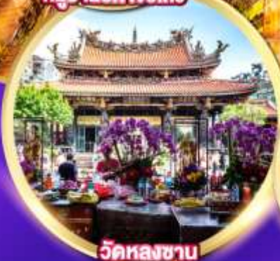
วัดหลงชาน