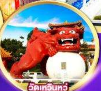
วัดเหวินหัว