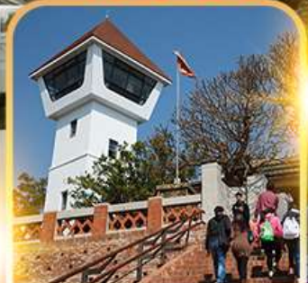
ถนนเก้าโบราณอันพิง