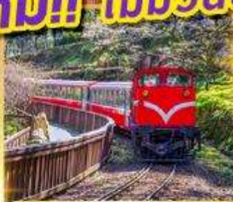
อุทยานอาลีสาน