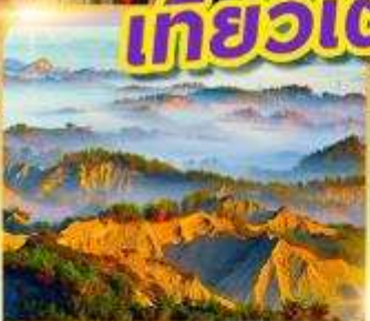
อุทยานหิน โลกพระจันทร์