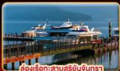
ส่งเรือทะเลสาบสุริยจันทร์

"นั่งรถไฟชมอุทยานอาลีซาน" ปล่อยคอมลอยเส้นทางรถไฟผิงซี