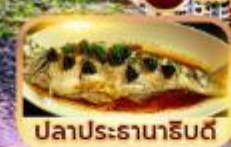
ปลาประดาน้ำดิบดี