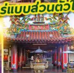
ศาลเจ้าจื่อหนานกง