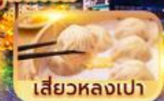
เสี่ยวหลงเปา