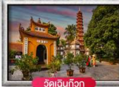
วัดเอนกวิวก