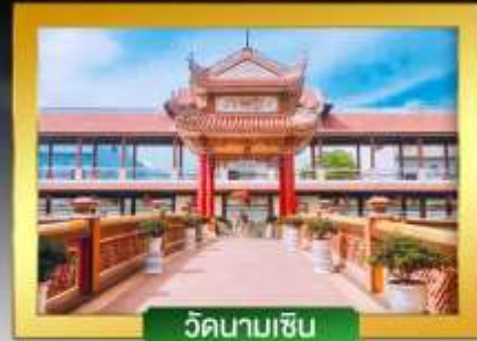
วัดนามเซิน