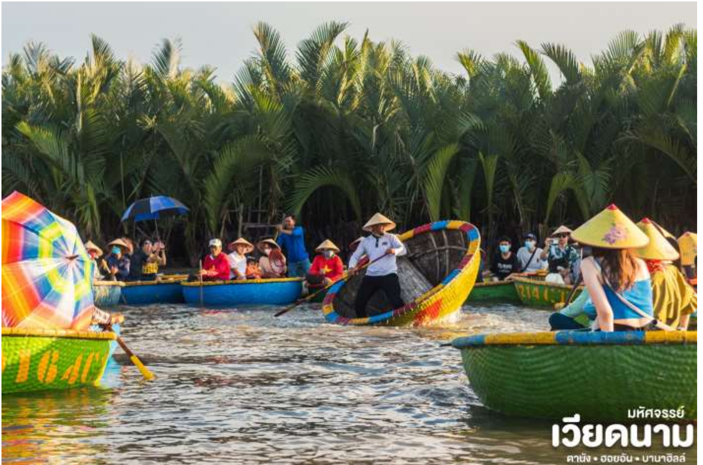
มหัศจรรย์ เวียดนาม ตานัง • ฮอยอัน • บานาฮิลล์