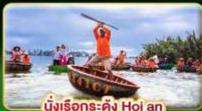
นั่งเรือกระดิง Hoi an