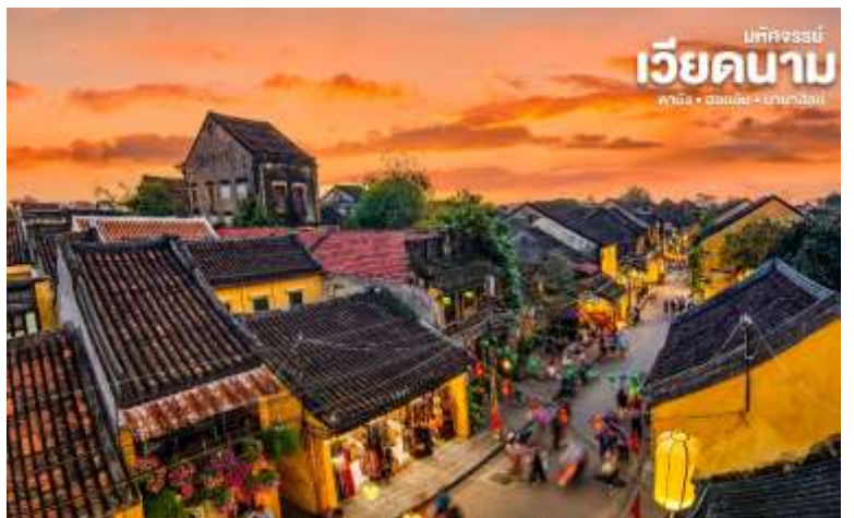
มหัศจรรย์ เวียดนาม ตานัง • ฮอยอัน • บานาฮิลล์

เมืองมรดกโลกทางวัฒนธรรมเนื่องจากเป็นสถานที่สำคัญทางประวัติศาสตร์ แม้ว่าจะผ่านการบูรณะขึ้นเรื่อยๆแต่ก็ยังคงรูปแบบของเมืองฮอยอันไว้ได้ นำท่านเดินทางด้วยรถโค้ชปรับอากาศเดินทางเข้าสู่ตัวเมืองฮอยอัน นำท่านชม วัดจีน เป็นสมาคมชาวจีนที่ใหญ่และเก่าแก่ที่สุดของเมืองฮอยอันใช้เป็นที่พักปะของคนหลายรุ่น วัดนี้มีจุดเด่นอยู่ที่งานไม้แกะสลักลวดลายสวยงามท่านสามารถทำบุญต่ออายุโดยพิธีสมัย์โบราณ คือ การนำรูปที่ขีดเป็นก้นหอย มาจุดทิ้งไว้เพื่อเป็นสิริมงคลแก่