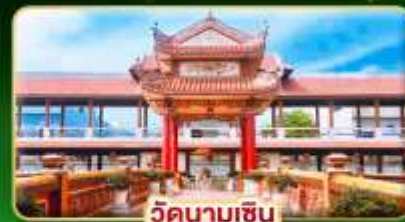
วัดนามเซิน