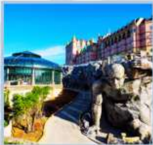
Tou Eclipse Square