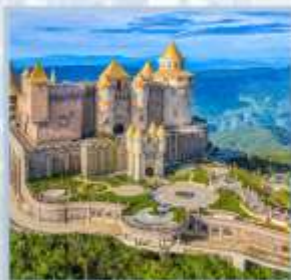
ปราสาทจันทร์