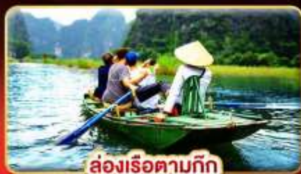
ล่องเรือตามก๊ก