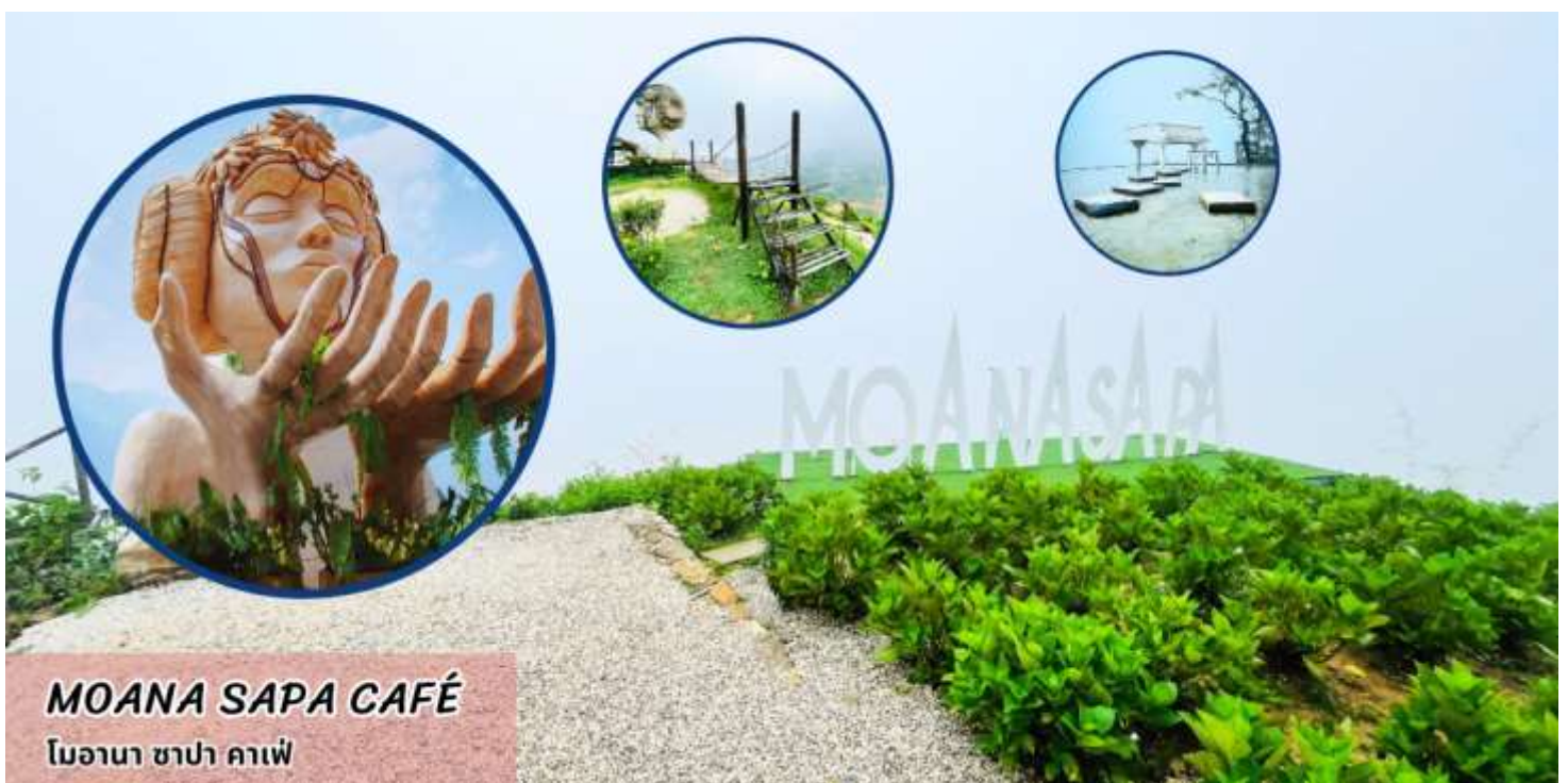
MOANA SAPA CAFÉ โมอานา ซาปา คาเฟ่

นำท่านเช็คอินแลนด์มาร์คแห่งใหม่ของซาปา โมอาน่า ซาปา คาเฟ่ (MOANA SAPA CAFÉ) จำลองไฮไลท์ของที่เที่ยวดังแต่ที่มารวมไว้ให้ท่านได้ถ่ายรูปท่ามกลางบรรยากาศที่โอบล้อมไปด้วยภูเขา ให้ท่านอิสระเลือกซื้อเครื่องดื่ม และเพลิดเพลินกับสายหมอกจางๆ พร้อมกับบรรยากาศสุดฟิน อิสระให้ถ่ายภาพตามอัธยาศัย