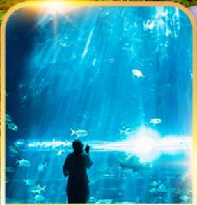
อควาเรียม