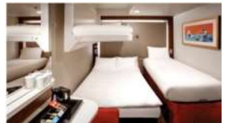
พัก 3-4 ท่าน