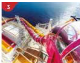
3 Waterslide Park Get drenched in fun on one of our six different waterslides.