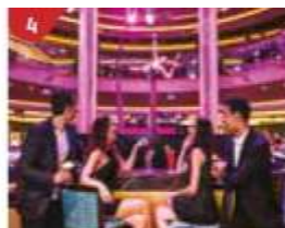
4 Bar 360 Catch live music and aerial acrobatic performances with a glass of champagne.