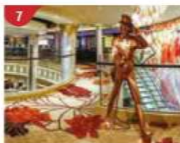
7 Johnnie Walker House™ Immerse yourself in the intricate world of premium Scotch whisky.