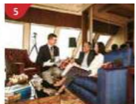
5 The Palace Indulge in European-style butler service and exclusive facilities.