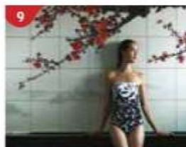
9 Crystal Life™ Spa Rejuvenate mind, body and soul with our holistic Western and Asian spa experience.