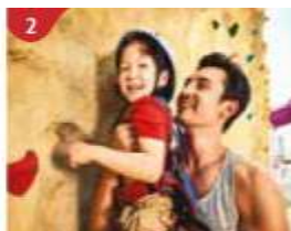
2 Rock Climbing Wall Challenge yourself on our mountainous rock climbing wall.