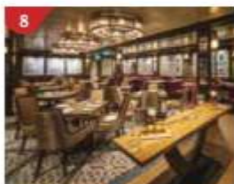
8 Bistro By Mark Best Relish contemporary Western cuisine from the internationally-acclaimed Australian chef.