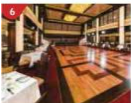
6 Dream Dining Room Savour a wide variety of Asian and international cuisine.