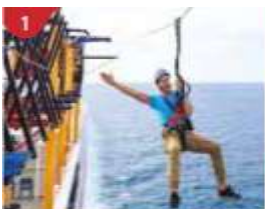
1 Ropes Course & Zipline Feel the thrill of gliding above the ocean on a 35-metre zipline.