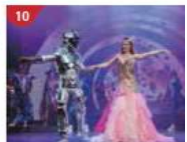
10 Zodiac Theatre Enjoy live production shows from the acclaimed award-winning entertainment team.