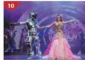
10 Zodiac Theatre Enjoy live production shows from the acclaimed award-winning entertainment team.