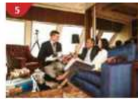
5 The Palace Indulge in European-style buffet service and exclusive facilities.