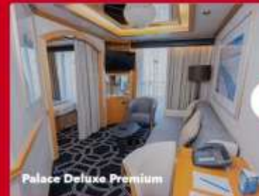
Palace Deluxe Premium