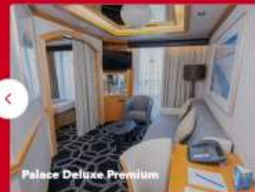
Palace Deluxe Premium