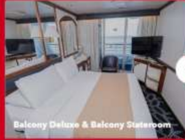
Balcony Deluxe & Balcony Stateroom