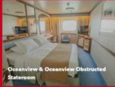
Oceanview & Oceanview Obstructed Stateroom